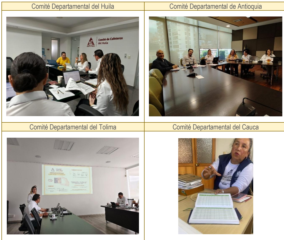
ILUSTRACIÓN 2. EVIDENCIA FOTOGRÁFICA DE LAS VISITAS IN SITU REALIZADAS A LOS COMITÉS DEPARTAMENTALES CON ALTA CONCENTRACIÓN DE PRODUCTORES DE CAFÉ

Asimismo, la validación remota para los restantes comités confirmó la estructura democrática a nivel territorial y no se identificaron bloqueos en la participación de los productores.