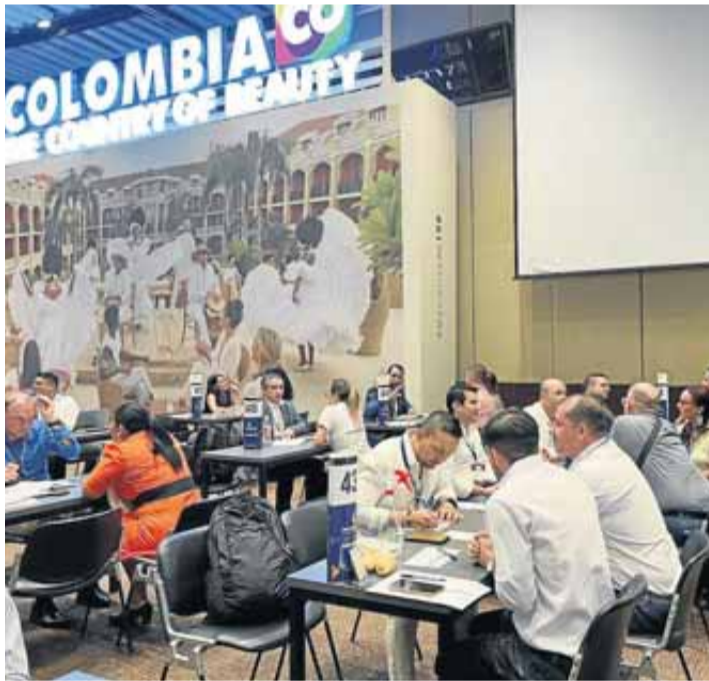
ccc Rueda de negocios.

"La internacionalización requiere una preparación meticulosa. Por eso, hemos creado esta ruta junto a otros aliados, para acompañar a todos los empresarios y empresarias, que quieran presentarse a la Macrorrueda 2025. Nuestro acompañamiento cubre desde la formación básica hasta es-