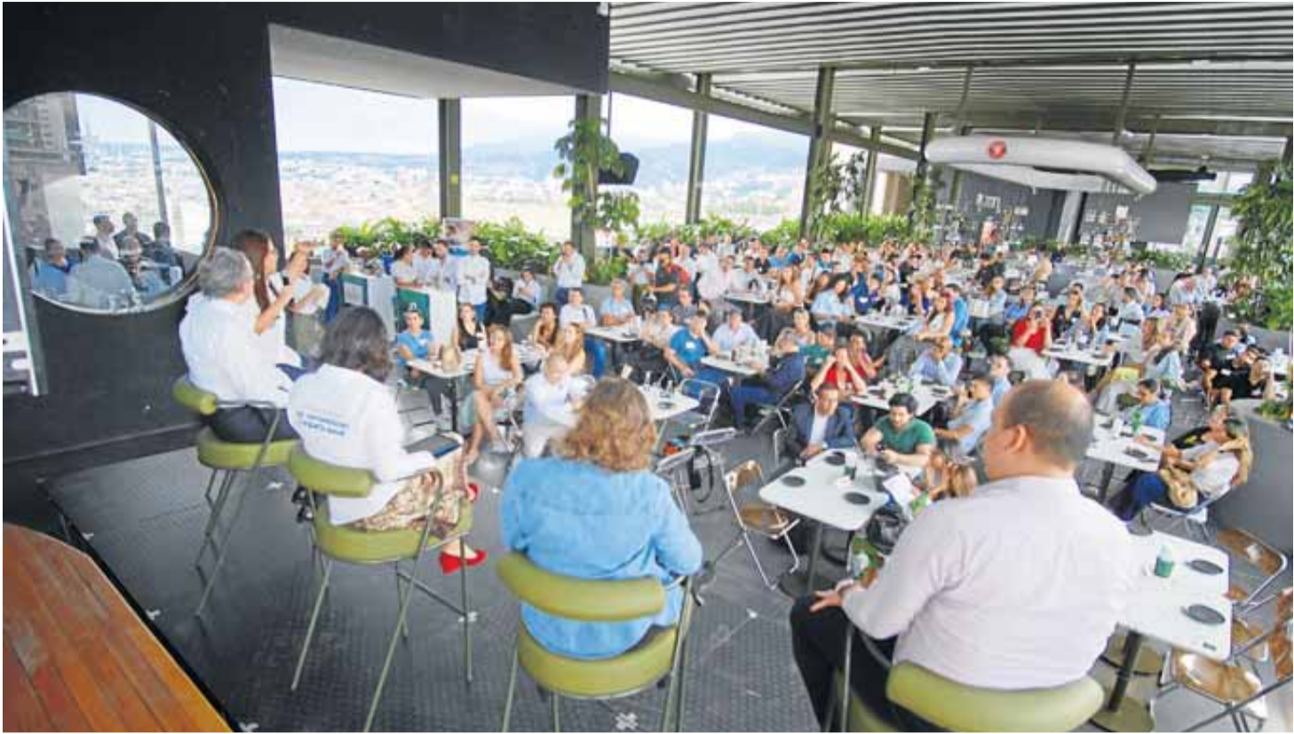
ccc Lanzamiento Ruta de Acompañamiento para la Macrorrueda “Colombia el País de la Belleza” 2025 de Procolombia, Cámara de Comercio de Cali.