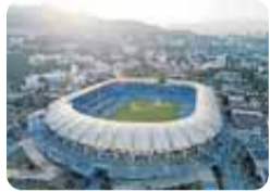
Estadio Pascual Guerrero

La época dorada del Deportivo Cali 1965 y 1974