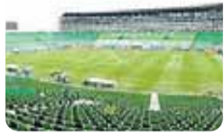
Estadio Monumental de Palmaseca (Deportivo Cali es el dueño)