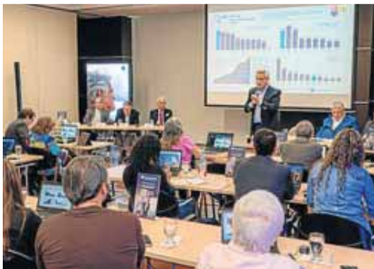
Banco de Occidente

En la reciente asamblea de accionistas del Banco de Occidente la entidad aprobó el pago de dividendos a sus accionistas por $133. Los dividendos se pagarán los primeros 10 días de cada mes, desde abril de 2025 y hasta marzo de 2026. El Banco reportó unas utilidades durante 2024 de $494.992 millones, lo que representó 15% más que en 2023. Los activos totales también aumentaron 13,6%. (ISG)