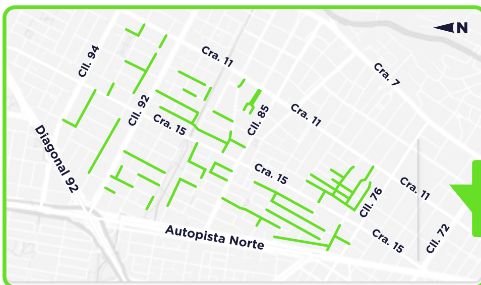
Calles y carreras con Zonas de Parqueo Pago