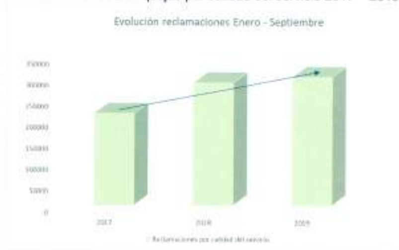
Gráfica 1. Evolución quejas por calidad del servicio 2017 – 2019

Estas situaciones, a criterio de la Superintendencia de Servicios Públicos Domiciliarios, denotan dificultades en materia de calidad que afectan a los usuarios finales del servicio de energía eléctrica atendidos por CODENSA.