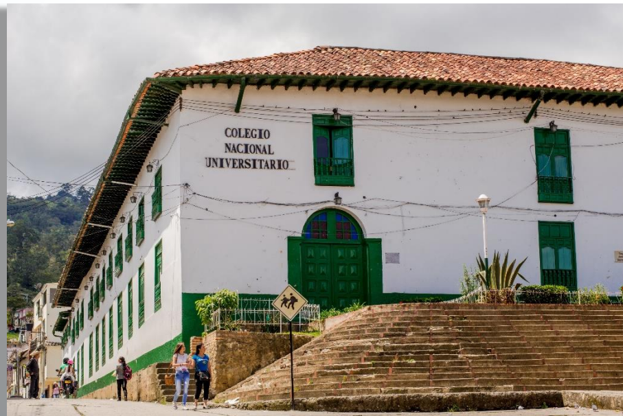
Colegio Nacional Universitario de Vélez