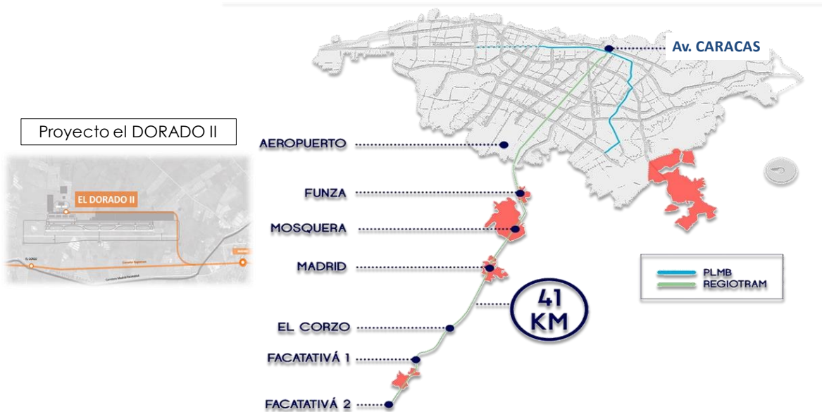
Figura 2. Esquema del RegioTram de Occidente